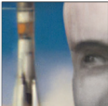
Topaz Gigapixel AI (Fiverr) zvětšení 6,2x 1772x1072 b tisk 300 dpi / 15x9 cm