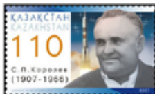
originál 286x173 b (pro tisk 1,46x2,42 cm)

Pokud uvažujete o trvalejším řešení, přehled zvětšovacího software naleznete zde .