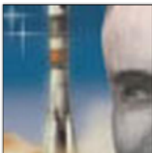
ImageEnlarger zvětšení 5x 1430x865 b tisk 300 dpi / 7,3x12,1 cm Lanczos3